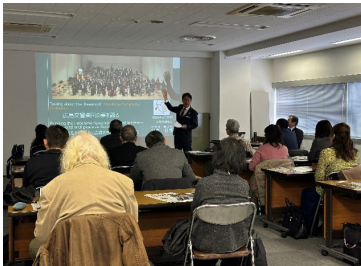
広島交響楽団勉強会

当ビューローが運営する、広島の観光事業者向けのコミュニティ「オール広島観光コミュニティ（ひろコミュ）」では、参加者に新たな知見を提供するとともに、観光客誘致のきっかけづくりとするため、定期的にメンバー向けのイベントや勉強会等を実施しています。