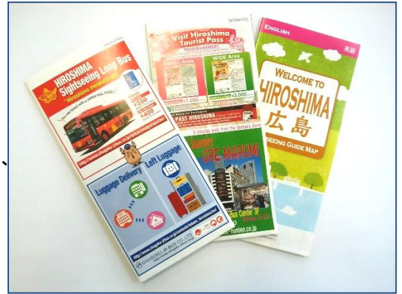
画像は英語版です。

※申込みが募集広告枠数を超えた場合は、「ガイドマップ広告掲載取扱要綱」第7条により決定。